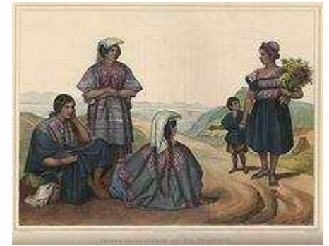
Representación Nebel de indígenas en la sierra

A mediados y finales del siglo XIX, las Academias de América Latina comenzaron a convertirse del fuerte neoclasicismo a la Academia realista. Se comenzaron a realizar representaciones más realistas, con especial énfasis en los detalles. Las escenas más comunes de este estilo eran retratos de clases altas, escenas bíblicas y batallas, especialmente las de la época de la independencia. Cuando la Academia de San Carlos se volvió a abrir, después del cierre de 1843, se implementó es estilo realista, gracias a las nuevas facultades españolas e italianas. A pesar de del apoyo del gobierno y los temas nacionalistas, los artistas nativos estaban un poco más a favor de los europeos. Uno de los principales artistas del siglo XIX era catalán, su nombre era Pelegrí Clavé, el cual pinto paisajes, pero fue más conocido por sus pinturas de la élite intelectual de la Ciudad de México. Algunos pintores realistas también intentaron retratar a la cultura azteca, la gente que representaba a los indígenas y trajes basados en códices de la época de la conquista, uno de ellos era Félix Parra, cuyas representaciones de la conquista eran asociadas con el sufrimiento de los indígenas. En 1869, José Obregón, pinto "el descubrimiento del pulque", el baso su representación en la arquitectura de los códices Mixtecas, pero falsifico los templos como escenario de tronos. 54