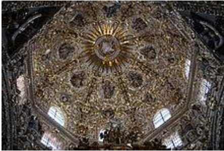
Cúpula de la capilla del Rosario en la Ciudad de Puebla

Un elemento importante del barroco mexicano eran las columnas, en particular la parte central del capital y la base, las cuales pueden clasificarse en seis tipos, incluida la columna salomónica y el estípite (arquitectura) (una pirámide truncada invertida). En el periodo colonial, más tarde, incluso si el resto de la estructura no estaba totalmente decorado como en el estilo "purista", las columnas y los espacios se hallaban exageradamente decorados. 36 37 El desarrollo del barroco en México hizo que se crearan sub-estilos y técnicas. El barroco "estucado" era puramente decorativo y no empellaba ninguna característica arquitectónica, las características se moldeaban a partir de estucos con detalles intrincados y bien cubiertos de oro o pintura. Esta técnica alcanzó su apogeo en el siglo XVII en Puebla y Oaxaca; ejemplos de esto se encuentran en la Capilla del Rosario en Puebla, Puebla y en la iglesia de Tonantzintla. Una de las razones por las cuales esta técnica desapareció fue porque el trabajo de estuco se disolvió. 38