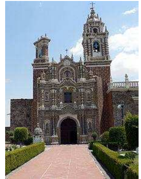
Fachada de la iglesia de Acatepec, de estilo barroco con mosaico Talavera.

Otro estilo del barroco que apareció más tarde en México fue conocido como churrigüesco mexicano, sin embargo el término técnico para este estilo anticlásico muy exuberante es: ultra barroco, se originó en España durante como decoración arquitectónica, extendiendo a la escultura y al mobiliario tallado. 41 En España el elemento definitivo del estilo ultra barroco fue el uso de la columna salomónica junto con la profusa decoración. 42 En México la columna salomónica aparece también, pero el principal elemento en México del estilo ultra barroco es el uso de la columna de la Estípite (arquitectura), esta no es una columna como tal, sino más bien es una base alargada en forma de una pirámide truncada invertida, esto se puede ver en la Catedral Metropolitana de la Ciudad de México en el portal de los reyes y el altar principal del Tabernáculo. 33 El estilo ultra barroco fue inducido a México por Jerónimo de Balbás, cuyo trabajo artístico en un altar de la Catedral de Santa María de la Sede de Sevilla fue usado de inspiración para el altar de los Reyes, construido en 1717. Balbás utilizó la estípite para transmitir una sensación de fluidez, pero sus seguidores mexicanos decidieron