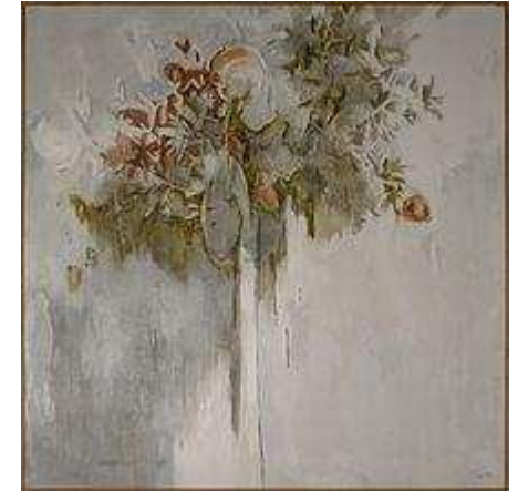
"integridad" por Sandra Pani