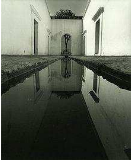
Centro fotográfico Álvarez Bravo en el Instituto de Artes Gráficas de Oaxaca.

Manuel Álvarez Bravo experimentó con la abstracción en su fotografía y formó su propio estilo en cuestión de los ritos y tradiciones mexicanas. El trabajo desde 1920 hasta su muerte en 1990, al igual que otros artistas del siglo XX que estaban preocupados con el equilibrio de las tendencias artísticas internacionales con la expresión de la gente y la cultura mexicana. Sus técnicas fotográficas estaban interesadas en transformar lo ordinario en fantástico. Desde finales de la década de 1930 a la de 1970, su fotografía desarrolló junto con nuevas tecnologías, como el color utilizando los mismo temas. En la década de 1970 experimentó con desnudos femeninos. 106