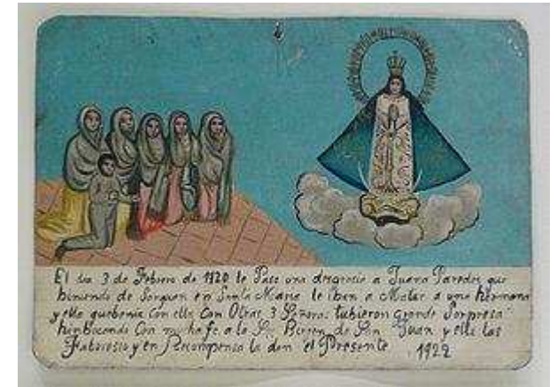
Pintura votiva de principios de 1920 en honor a Nuestra Señora de San Juan de los Lagos

México tuvo dos ventajas durante este periodo, la primera fue una generación de talentosos actores y directores de cine. Estos actores incluyen a; María Félix, Jorge Negrete, Pedro Armendáriz, Pedro Infante, Cantinflas y directores como Emilio Fernández y el director de fotografía Gabriel Figueroa. Muchas de estas estrellas tuvieron apertura en Estados Unidos y en el Festival de Cannes. 86 88 En la esquina de la Brea y en el Paseo de la Fama de Hollywood, hay una escultura de cuatro mujeres que representan a los cuatro pilares del cine, una de las cuales es la artista mexicana Dolores del Río. 86