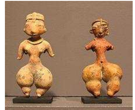
Figurillas femeninas de la cultura Tlatilco

La mayoría de las obras de piedra durante el periodo mesoamericano se asocian con la arquitectura monumental que, junto con la pintura mural, son consideradas un parte integral de la arquitectura de esos tiempos. 18 La arquitectura monumental comenzó con los olmecas al sur de Veracruz y en la zona costera de Tabasco, en lugares como San Lorenzo; grandes templos o pirámides pueden verse en lugares como Montenegro, Chiapa de Corzo y la Venta. Esta técnica se esparció a Oaxaca, la zona del Valle de México, ciudades como Monte Albán, Cuicuilco y Teotihuacan. 4 19 Estas ciudades, tarde o temprano, lograron tener un núcleo de construcciones como plazas, templos, palacios y estadios para el juego de pelota. La ubicación de estos lugares de basa en las direcciones cardinales y la astronomía para fines ceremoniales, como los rayos del sol del equinoccio de primavera que se esculpieron o pintaron en una imagen. Esto se relaciona generalmente con el sistema del calendario. 20 Las esculturas en relieve o pintadas eran creadas con la