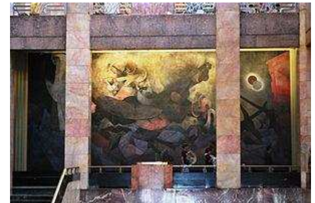
"México de Hoy" de Rufino Tamayo en el primer piso del Palacio de Bellas Artes (Ciudad de México)