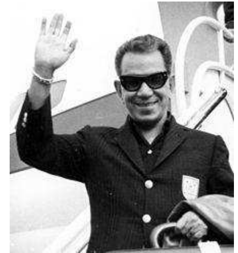
Cantinflas, uno de los principales actores del siglo de oro del cine mexicano