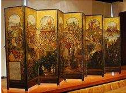
"Pantalla de Biombo" con representación de la conquista española de México en el Museo Franz Mayer

recuerdos de México. La producción de estas pinturas se detuvo después de la Independencia de México y con las medidas políticas que se implementaron sobre la identidad mestiza, que se trataba de implementar medidas contras las personas que ocultaban este tipo de pinturas, lo cual duró hasta comienzos del siglo XXI, cuando los estudiosos comenzaron a informarse. 44