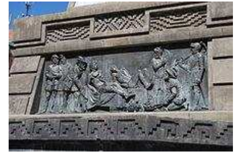
La tortura de Cuauhtémoc en un monumento en su honor en el Paseo de la Reforma

La Academia de San Carlos sigue siendo el centro de la pintura académica y la más prestigiosa institución de arte en México, pero durante la Independencia de México tuvo que cerrar. 49 A pesar de la asociación que tenía la Academia con la Corona Española y con el estilo europeo, la Academia fue reabierta por el nuevo gobierno después de que México obtuviera la Independencia completa en 1821. Sus ex profesores y estudiantes, murieron durante la guerra o regresaron a España, pero cuando se volvió a abrir se encargaron de conseguir a los mejores estudiantes de arte del país y continuaron con las enseñanzas del estilo europeo, lo cual duro hasta el siglo XX. 49 50 La Academia fue renombrada como; La Academia Nacional de San Carlos, el nuevo gobierno siguió favoreciendo el estilo neoclasicista, ya que pensaba que el barroco era símbolo del colonialismo. El estilo neoclásico continuo durante el reinado de Maximiliano I de México, aunque el presidente Benito Juárez lo apoyo de mala gana, ya que consideraba que seguía siendo parte del colonialismo. 47