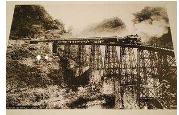
Imagen del puente de Metlac, tomada por Guillermo Kahlo

La fotografía moderna en México no comenzó como una forma de arte, sino más bien como parte de la documentación asociada con los periódicos y los proyectos del gobierno. Se remonta al gobierno de Porfirio Díaz o el "Porfiriato" de finales del siglo XIX hasta 1910. 92 93 La fotografía en la era porfiriana se inclina fuertemente hacia la presentación de la modernización de la nación para el resto del mundo, con la Ciudad de México como su obra maestra cultural. Esta imagen fue basada en elementos europeos con otros elementos autóctonos de distinción. 94 Las imágenes utilizadas de los indígenas durante el porfiriato fueron realizadas por Ybañez y Sora con un estilo de pintura conocido como el Costumbrismo que fue muy popular fuera de México. 90 Sin embargo el más importante fotógrafo de la época porfiriana fue Guillermo Kahlo que trabajó asociado con Hugo Brehme. 90 Kahlo creó su propio estudio en la primera década de 1900 y fue contratado por las empresas y el gobierno para documentar la arquitectura, interiores, paisajes y fábricas. 95 El estilo de Kahlo se reflejó en las narraciones de la época, únicamente se centró en las principales construcciones y eventos, evitando la población común, 96 evitó temas que insinuaban la inestabilidad política del país en ese momento como las Huelgas. 97 Un importante proyecto de Kahlo fue el inventario fotográfico de la arquitectura de la iglesia de la colonia española en México