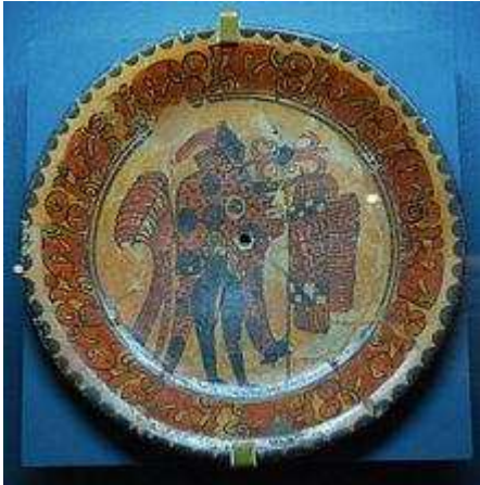
Placa de cerámica pintada del Museo Regional de Antropología e Historia de Chiapas

siguen siendo una parte muy importante del arte desde hace 2000 años. En el periodo olmeca, la mayoría de las figuras de cerámica eran producidas en tamaños pequeños, pero las esculturas de gran escala alcanzaban los 55 cm. 10 11 Después del periodo Pre-Clásico, la producción de esculturas de cerámica se redujo al centro de México, excepto en la zona arqueológica de Chupícuaro. En las zonas mayas, el arte desaparece en el periodo Pre-Clásico, para volver a reaparecer en el periodo Clásico, en su mayoría en formas de silbatos o instrumentos musicales. En algunas áreas, como en Veracruz, la creación de figuras de cerámica continuó interrumpidamente hasta la conquista española, como artesanías, no como arte formal. 12