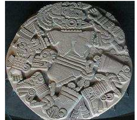
Disco que representa a la diosa Coyolxauhqui en el museo del Templo Mayor.

El más antiguo de los artistas del México colonial era de origen español; llegó a México cuando llevaba la mitad de su carrera como artista. Otros personajes con características similares llegaron a México, como el fraile Alonso López de Herrera. Después de ellos, los artistas comenzaron a nacer en México, pero aún continuaban con las técnicas europeas, a menudo de grabados importados, los cuales comenzaron a aparecer en las obras de arte de México porque en Europa ya habían pasado de moda. 1 Durante el periodo colonial los artistas trabajaban en grupos y no individualmente; cada uno de estos grupos tenía sus propias reglas, preceptos, mandatos y técnicas de innovación para sus obras de arte. 26