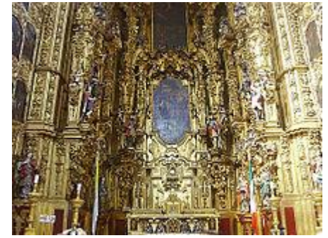
Detalles del altar de los Reyes en la Catedral Metropolitana de la Ciudad de México

La pintura barroca se estableció firmemente a mitades del siglo XVII con la obra del español Sebastián López de Arteaga, su pintura se ejemplifica con el lienzo llamado "Tomás el incrédulo" de 1643. En esta pintura, se muestra a Tomás el Apóstol metiendo su dedo en la herida de Cristo para enfatizar su sufrimiento. El cuadro cuenta con una leyenda que dice "el verbo hecho carne", esta obra de arte es un ejemplo de la intención didáctica del barroco. 31 Una diferencia entre los pintores mexicanos y los europeos, es que estos últimos prefieren la franqueza y la claridad realista, sobre fantásticos colores, proporciones alargadas y relaciones espaciales extremas. El objetivo era crear un escenario realista, en el que el espectador pueda imaginarse como parte de la obra. Este estilo fue creado por Caravaggio en Italia, después se hizo popular entre los artistas de Sevilla, que después lo trajeron a Nueva España. 31 Del mismo modo, las esculturas del barroco, representan escalas de tamaños naturales, tonos de piel realistas y simulación de prendas de hilo de oro, que se realizan a través de una técnica llamada "estofado", que es la técnica de aplicar pintura sobre el oro. 31