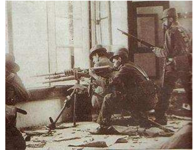
Escena de la Decena Trágica de los archivos Casasola

Un pionero anterior de la fotografía mexicana fue Agustín Víctor Casasola. Al igual que Kahlo, comenzó su carrera en el porfiriato, pero él se centró en la fotografía para revistas, de nuevo al igual que Kahlo, las obras de Casasola antes de la revolución mexicana no se centró en fotografías controversiales, centrándose así en la vida de la élite. Sin embargo, el estallido de la guerra civil causó que Casasola quisiera cambiar de temas para sus obras, comenzó no solo a centrarse en personajes protagonistas (como Pancho Villa) y escenas de batallas en general, pero con las ejecuciones y las muertes, Casasola se centró en las personas con rostros que representaran muestras de dolor, la bondad y la resignación. Su trabajo durante este tiempo produjo una gran colección de fotografías, muchas de las cuales son muy familiares para los mexicanos y se han reproducido y reutilizado, a menudo sin crédito para Casasola. Después de la guerra, Casasola continuó fotografiando personas comunes, especialmente a los migrantes a la Ciudad de México durante los años 1920 y 1930. Su total de archivos conocidos comprenden alrededor de medio millón de imágenes con muchos de sus trabajos archivados en el monasterio de San Francisco en Pachuca. 92