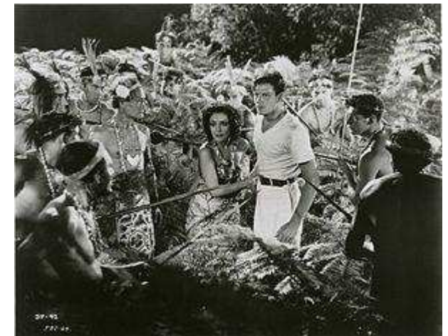
Escena del ave del paraíso (1932) con Dolores del Río