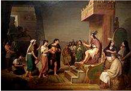
El descubrimiento del pulque , por José Obregón, Museo Nacional de Arte (México)

Una serie de artistas nacidos en el país durante la época siguieron a los pintores románticos europeos, en su deseo de documentar las diversas culturas de México. Este tipo de pintores entraron en el estilo del "Costumbrismo", derivado de la palabra "costumbre". El estilo de estos pintores no siempre era renacentista, también utilizaban otros más. La mayoría de estos artistas eran de clases altas y educados en Europa. Mientras que los pintores europeos veían esto como temas exóticos, los costumbristas tenían un sentido más nacionalista de su país de origen. Uno de los pintores se llamaba Agustín Arrieta y venía de Puebla, quien aplicó las técnicas realistas en escenas de su ciudad natal, capturándolas con cerámica y azulejos de vivos colores, las escenas de la vida cotidiana a menudo representaban mujeres en la cocina, vendedores negros y Afroperuanos. 53