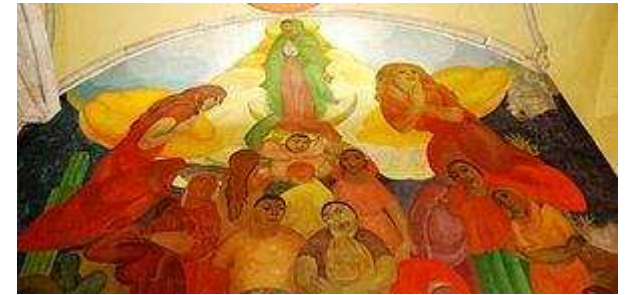
Una parte de la "Alegoría a la Virgen de Guadalupe", de Fermín Revueltas, ubicado en una de las paredes de la Real y Pontificia Universidad de México

El primer protagonista en la producción de murales modernos en México fue Dr. Atl (Gerard Murillo), nació en Guadalajara (Jalisco) en 1875. Él modificó su nombre para identificarse como mexicano, Atl trabajó para promover Artesanías y arte folklórico mexicano. Aunque tuvo éxito como pintor en Guadalajara, sus ideas radicales contra la Academia o el gobierno lo llevaron a trasladarse a la Ciudad de México, que era más liberal. En 1910, meses antes del inicio de la Revolución mexicana, Atl pintó el primer mural moderno en México, él enseñó a grandes artistas que lo siguieron, incluyendo a los que llegaron a dominar la pintura mural mexicana. 55