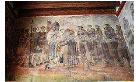
Mural en el que aparece Cortés saludando a los primeros 12 franciscanos de México en el antiguo monasterio de Ozumba, en el Estado de México.

El estilo barroco fue trasladado a México por los españoles, donde desarrolló sus propias variaciones desde el siglo XVI al XVIII. 33 El arte y la arquitectura barrocos se utilizaron principalmente para las iglesias, sobre todo porque en todas las ciudades, pueblos y aldeas, las iglesias eran el centro de las comunidades, con calles de un patrón similar alrededor de ellas. Esto reflejaba el papel de la iglesia como el centro de la vida de las comunidades. El diseño de la iglesia del Virreinato de Nueva España tendía a seguir con patrones rectilíneos de cuadros y cubos, mientras que las iglesias contemporáneas europeas usaban patrones de curvas y orbes. 34 Los espacios de las iglesias barrocas en México tienden a ser menos ostentosos que los de los europeos, y la atención se centraba en el altar principal. El objetivo era la contemplación y la meditación y el exceso de ornamentación se creó para mantener la atención en los altares principales. 35