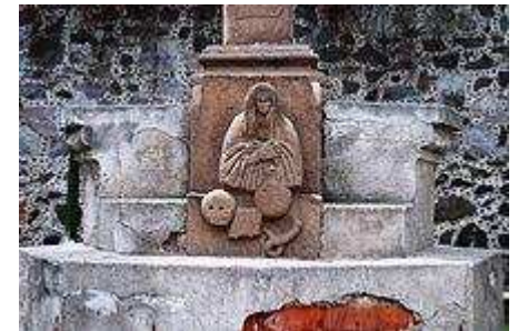
Primer plano de una representación tequitqui de la Virgen María en el antiguo monasterio situado en Acolman, Estado de México.