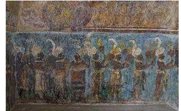
Mural maya de Bonampak

El arte prehispánico en México pertenece a una región cultural conocida como Mesoamérica, que corresponde al centro de México en Centroamérica, 3 y abarca tres mil años desde 1500 A.C. hasta el 1500 de nuestra era, se ha dividido en tres eras: Pre-Clásico, Clásico y Pos-Clásico. 4 La primera cultura dominante de Mesoamérica fue la de los olmecas, que alcanzó su punto máximo alrededor del año 1200 A.C. Esta cultura fue la creadora de muchos de los elementos asociados a Mesoamérica, como el sistemas de escritura, los calendarios, los primeros avances en astronomía, las esculturas monumentales, como la cabeza colosal y trabajos de jade, y fueron precursores de otras culturas como la de Teotihuacan, al norte de la Ciudad de México, el pueblo zapoteco en Oaxaca y la cultura maya en el sur de México, Belice y Guatemala. Mientras los imperios se levantaron y cayeron, los fundamentos culturales básicos de la cultura mesoamericana prevalecieron, hasta el imperio español. 5 Los elementos mesoamericanos se vieron reflejados en ciudades que incluían plazas, templos usualmente construidos en las bases de las pirámides, el lugar donde se jugaba el juego de pelota mesoamericano y una cosmología muy común. 3