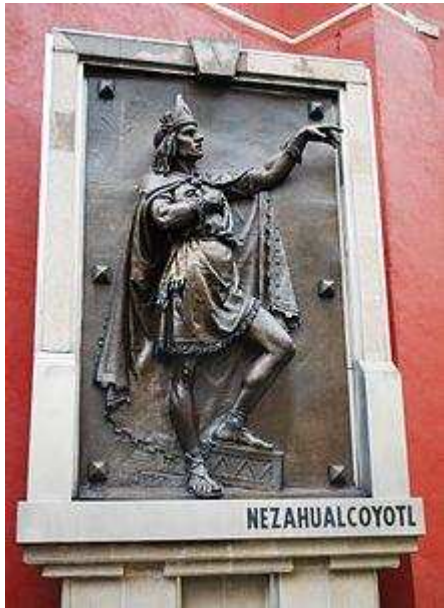
Escultura de Nezahualcōyotl (1888-1889) por Jesús Fructuoso Contreras en el Jardín de la Triple Alianza.

Hacia las últimas décadas del siglo XVIII el orgullo de la ciudad barroca de México, cultivado con sus obras pero también en los elogios y las apologeticas descripciones, se tambaleaba en la conciencia de sus habitantes ilustrados. 48