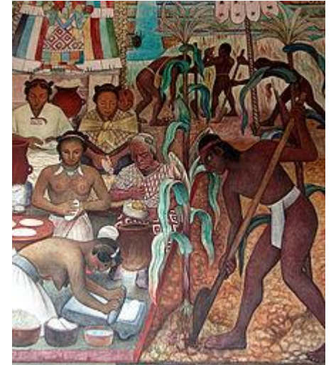
Detalle del mural de Diego Rivera en el Palacio Nacional (México)

La fuerza de este movimiento artístico fue tal que afectó a otras artes que estaban iniciando, como la fotografía y las artesanías, fuertemente promovidas como parte de la identidad mexicana. Desde la década de 1950, el arte mexicano rompió con el estilo muralista y ha sido más globalizado; un ejemplo es la integración de elementos asiáticos, con artistas mexicanos y directores de cine que tienen un efecto en el escenario mundial.