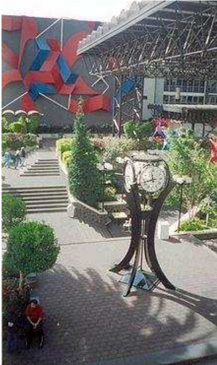
Mural y escultura reloj de Manuel Felguérez en Universidad La Salle (México), Campus central